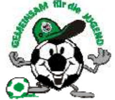
Förderverein Gelenauer Fußball u.ä.

Immer aktuell informiert → im Internet unter www.bsv-gelenau.de „Spielplan“. Unterstützen Sie unsere Mannschaften! Wir freuen uns auf Ihren Besuch! Die Spiele der 1. und 2. Mannschaft finden in Abhängigkeit von der Witterung überwiegend auf dem Platz „Sportareal Erzgebirgsblick“ statt. Herzlich willkommen! Für das leibliche Wohl ist gesorgt!